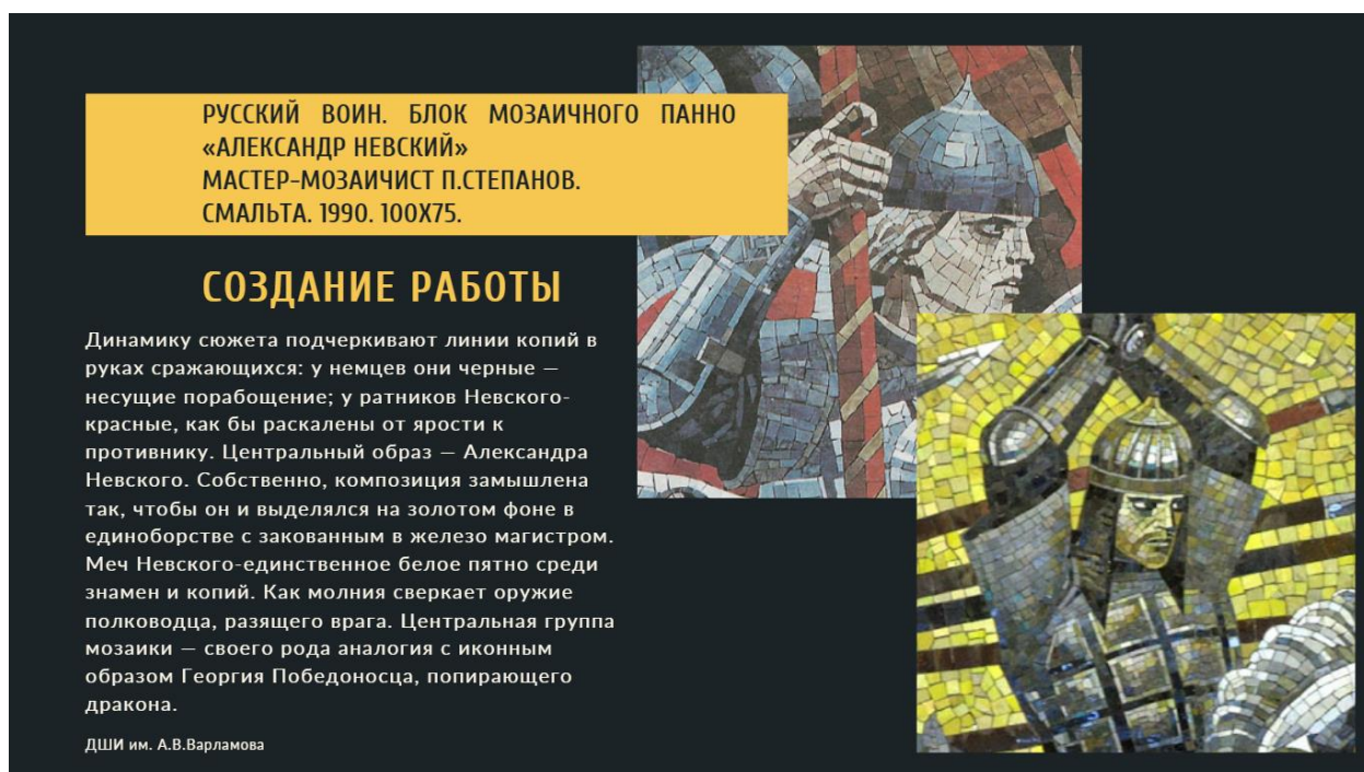
Фрагмент презентации «Образ А. Невского в мозаичном панно»