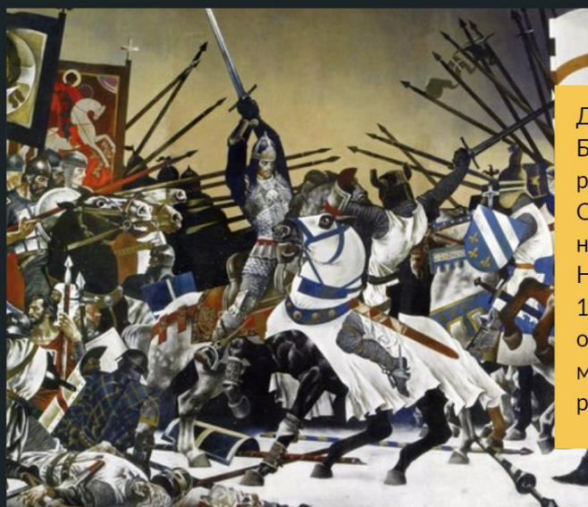
Фрагмент презентации «Образ А. Невского в мозаичном панно»