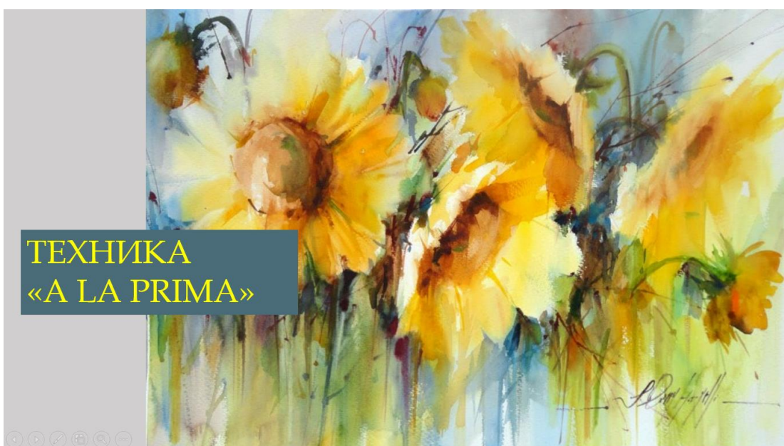
Фрагмент презентации Рисование в технике «A la prima»